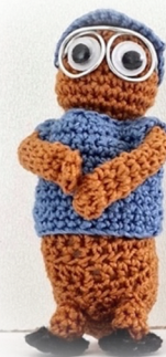
Deel nieuw ontwerp

Medio januari 2023 hoopt Haken met Marga weer met een volstrekt uniek project te komen. Zie de foto hiernaast voor een klein detail. Het patroon zal los verkocht worden, maar ook als een pakket. Dus extra voordelig voor als klant! Houdt de webshop en de facebookgroep (hakenmetmarga) goed in de gaten.